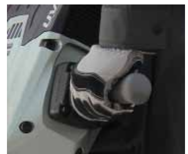
Agarres grandes con mayor comodidad