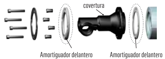
Diseño de amortiguador