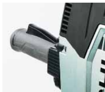
Palanca del interruptor grande para un mayor control